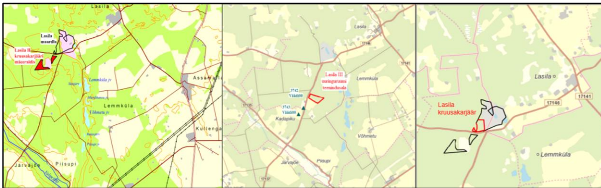
Joonis 4. Lasila II kruusakarjääri, Lasila III liivakarjääri ja Lasila kruusakarjääri asukohad (andmed vastavate karjääride keskkonnalubade taotlusmaterjalidest).

V1-15/14/275) mäeeraldised. Lähtuvalt eelnevast võib koosmõju olla Lasila II kruusakarjääri, Lasila III liivakarjääri ja taotletava Lasila kruusakarjääri vahel (joonis 4).